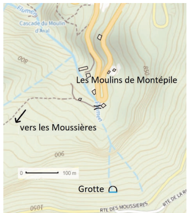
Figure 4 : Environnement des Moulins de Montépilé

Or pour les DALLOZ, l'habitat précité "à Montépilé" pouvait aussi inclure le lieu-dit les Moulins de Montépilé (Figure 4).