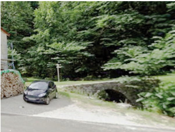
Figure 5 : Vieux pont sur le Flumen

emprunté plus loin par ce sentier présente en effet la moins forte pente à des km à la ronde. Du reste, le très vieux pont de pierre carrossable que l'on voit depuis la route ne correspond vraiment pas à un départ de sentier autour d'un pâtre de maisons (Figure 5).