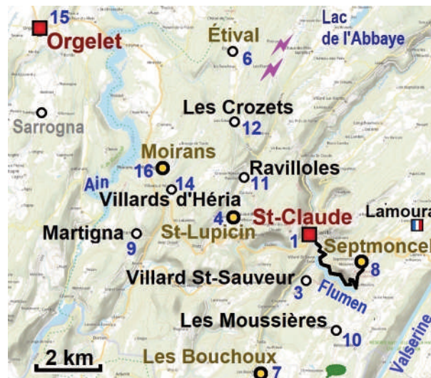
Figure 2 : Rang des communes dans un classement par nombre de naissances DALLOZ entre 1891 et 1915 (⚡, villages incendiés en 1637; 🌿, lieu-dit La Dalue)

Mais aujourd'hui, on connaît aussi une Marie-Christine DALLOZ, députée du Jura depuis 20 ans, et ancienne maire de Martigna (Fig 2).