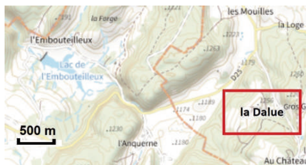
Figure 3: lieu-dit La Dalue, en limite de deux communes

Et aux Moussières en limite avec la commune de La Pesse, c'est-à-dire autrefois la paroisse des Bouchoux à la figure 2, le toponyme La Dalue fait certainement référence à ce statut, afin de marquer l'entrée en alleu pour cette ferme isolée (Figure 3). Soit de nouveau I et II, et la parenté phonétique o/ou/u. Et c'est aujourd'hui un gîte touristique, avec un site Internet.