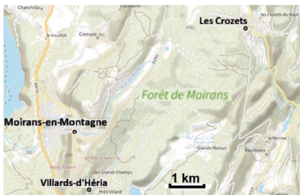
Figure 6 : Environs de Moirans-en-Montagne